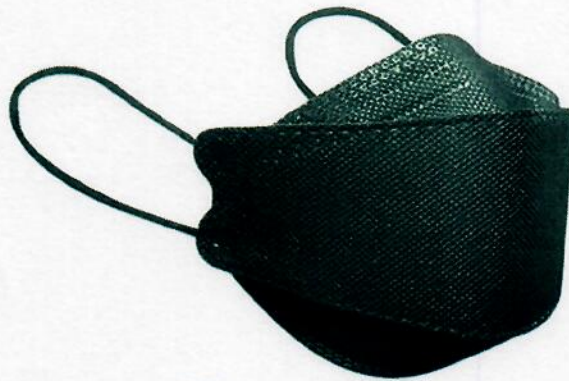
KF94, En color negro

Nota: Las mascarillas a cotizar deben cumplir con los términos de referencias indicados precedentemente, ver las imágenes.