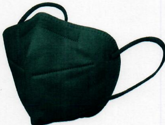
KN95 SIN FILTRO NEGRA