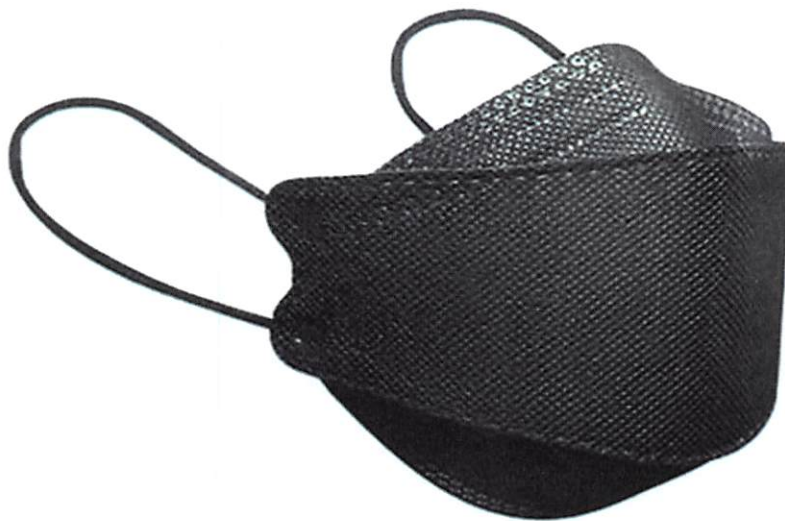
KF94, En color negro

Nota: Las mascarillas a cotizar deben cumplir con los términos de referencias indicados precedentemente, ver las imágenes.