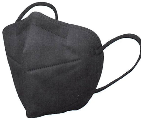
KN95 SIN FILTRO NEGRA