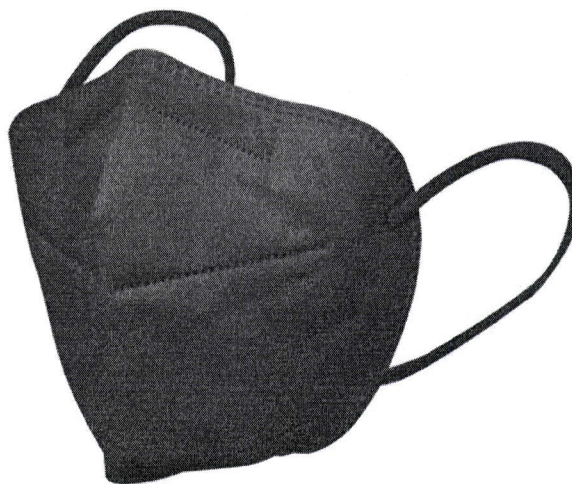
KN95 SIN FILTRO NEGRA